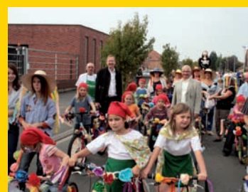
Les vélos fleuris du jardin pédagogique