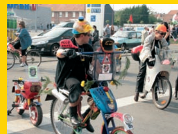
Le moto-club "écolo"