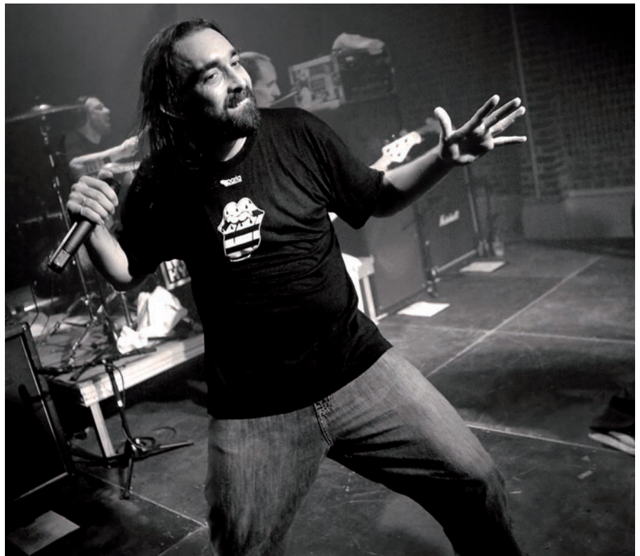
Mass Hysteria, un groupe de renommée internationale à Orchies

Cette année encore, près de 1000 spectateurs sur les deux jours de fête. Le vendredi soir, une tête d'affiche du rock enflamme le Musikadonf : Mass Hysteria. Le groupe propose un savoureux mélange de hardcore, métal,