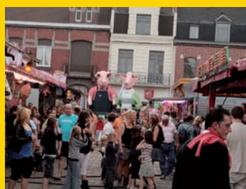
Un public nombreux pour le défilé et la ducasse