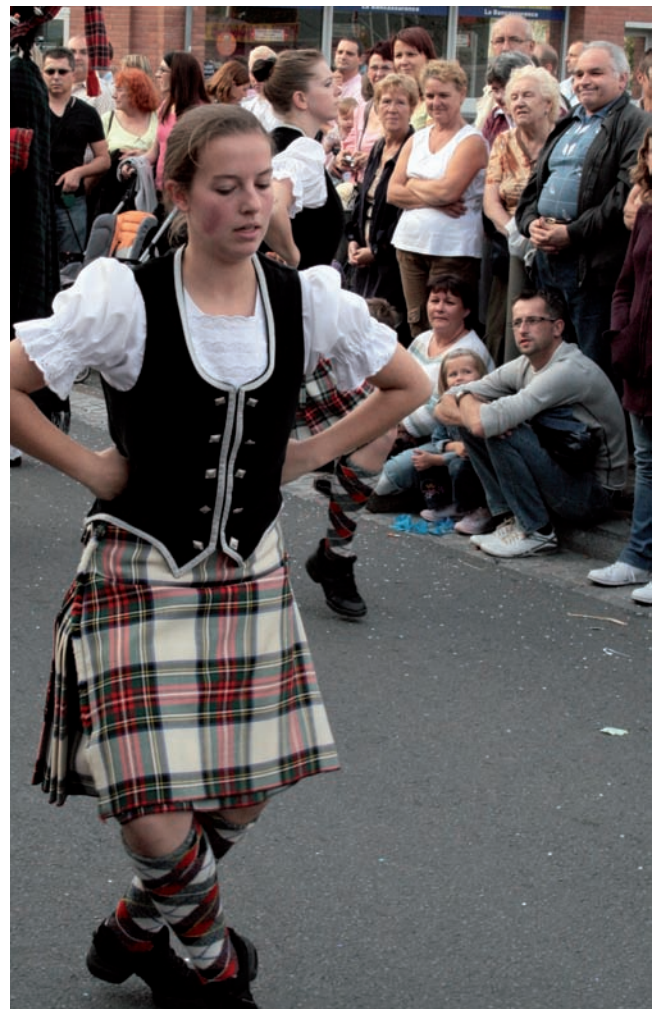
Le Red Hackle Pipe Band et ses danseuses, un parfum d'Écosse dans les rues d'Orchies