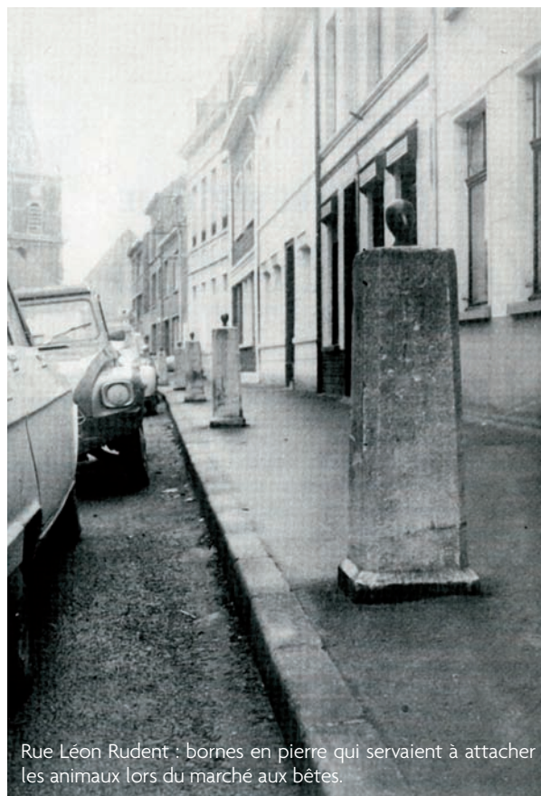
Rue Léon Rudent : bornes en pierre qui servaient à attacher les animaux lors du marché aux bêtes.

Le marché du vendredi, ancêtre de notre marché actuel, était plus particulièrement celui du beurre et