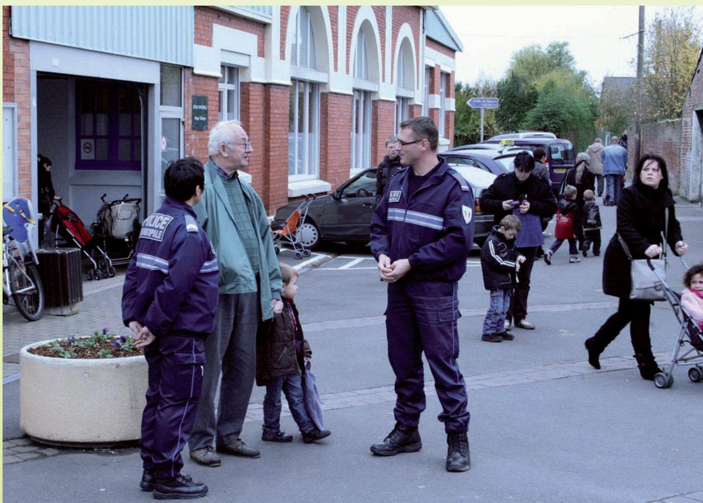
Les agents de la Police Municipale orchésienne

Actuellement on compte en France environ 18 000 policiers municipaux totalisant 12,8% de l'ensemble des effectifs de terrain au plan national. La Police municipale est aujourd'hui officiellement reconnue par le Ministère de l'Intérieur comme troisième composante des forces de l'ordre à côté de la police nationale et de la gendarmerie nationale. La police municipale est dotée d'un code de déontologie ainsi que d'une carte professionnelle.