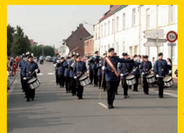
Showband FBL en ordre de marche