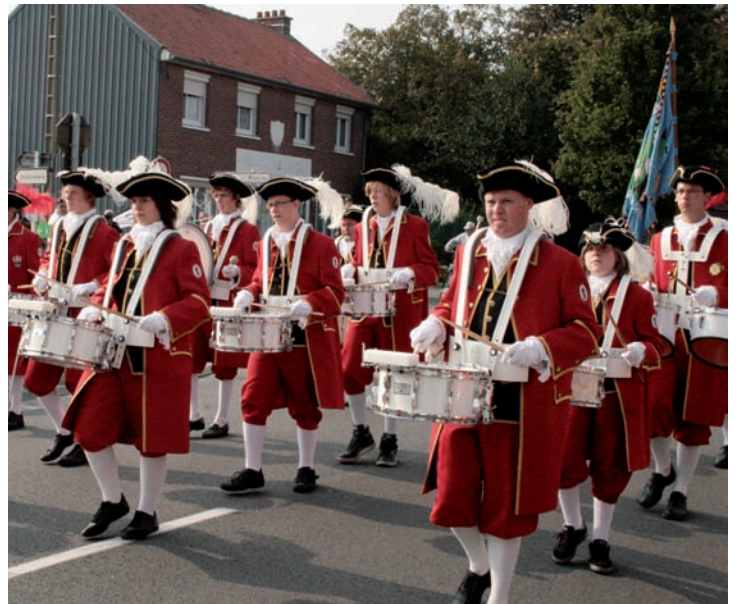
Costumes traditionnels pour les Gide Saint Sebastiaan AS