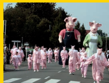
Les Pourchots et leurs géants