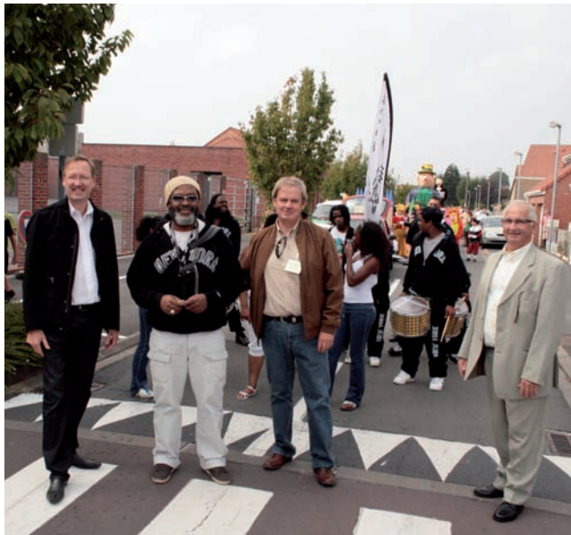
M. le Maire et ses adjoints ont accueilli chaque groupe