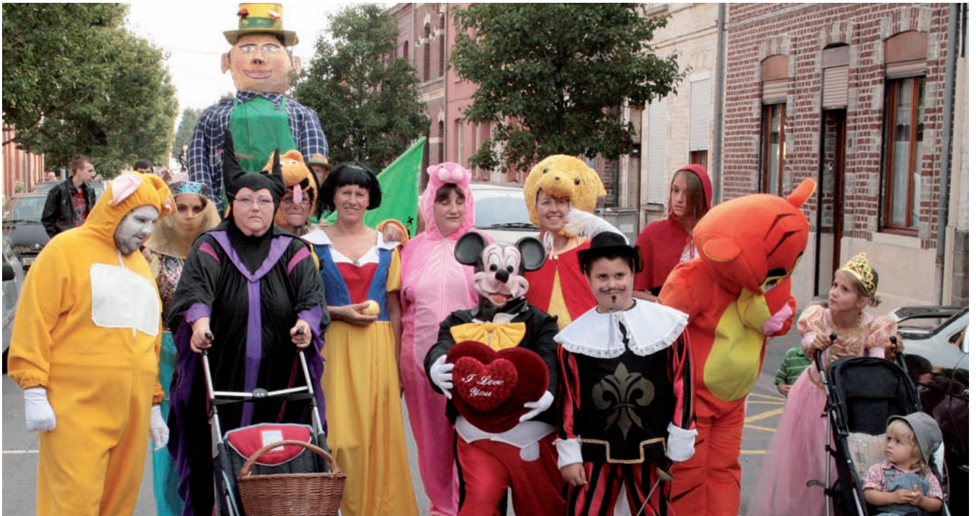
L'association des familles avait choisi pour thème les films de Disney