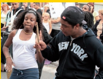
Un rythme entraînant avec Caribbain Brotherhood for real