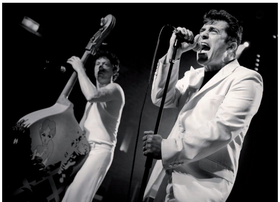
Les Forbans, toujours aussi dynamiques et rock'n roll.