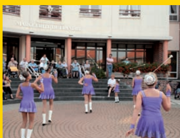
Les Alyzées devant la maison de retraite