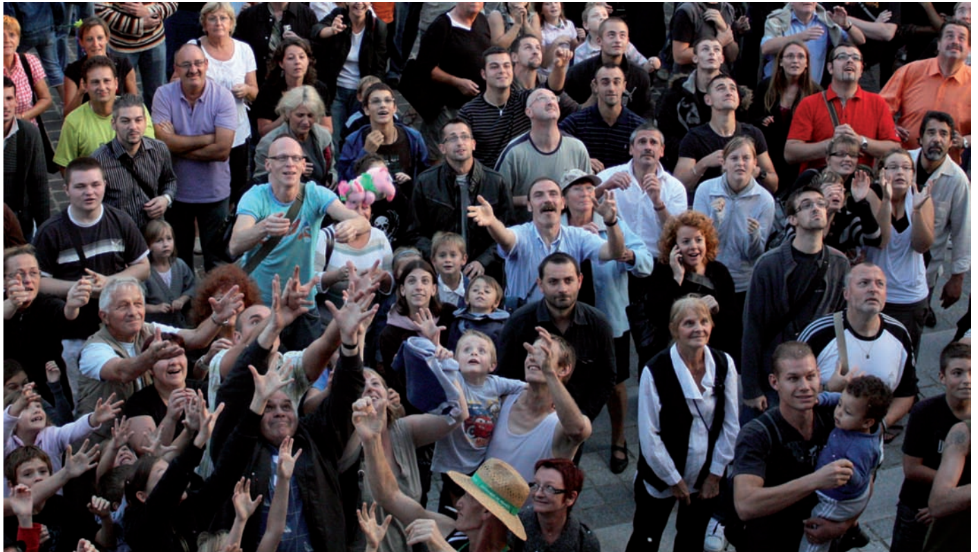
Le traditionnel lancer de cochons du haut de l'Hôtel de Ville