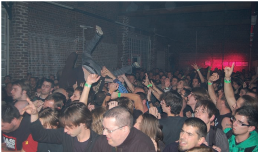
La Grange pleine à craquer avec une foule en délire